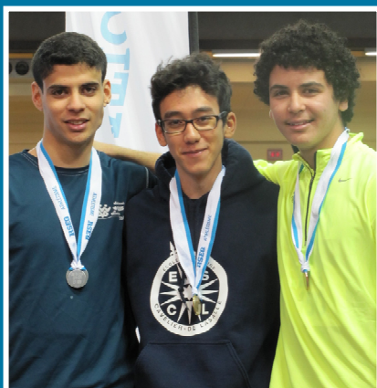
CHAMPIONNAT RÉGIONAL D'ATHLÉTISME EN SALLE PODIUM - 800M JUVÉNILE MASCULIN