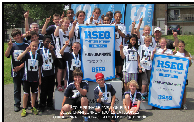
ÉCOLE PRIMAIRE PAPILLON-BLEU ÉCOLE CHAMPIONNE - TOUTES CATÉGORIES CHAMPIONNAT RÉGIONAL D'ATHLÉTISME EXTÉRIEUR

Nous croyons que le RSEQ Lac-Saint-Louis est un acteur incontournable dans le développement sportif scolaire. Nous croyons surtout que nos écoles sont des acteurs indispensables dans le développement du jeune par le biais du sport à l'école.