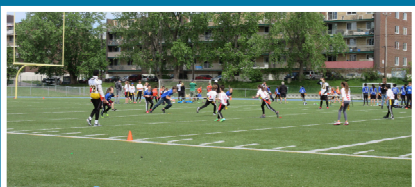
Championnat régional de mini-flag-football Organisé à l'école secondaire Dalbé-Viau