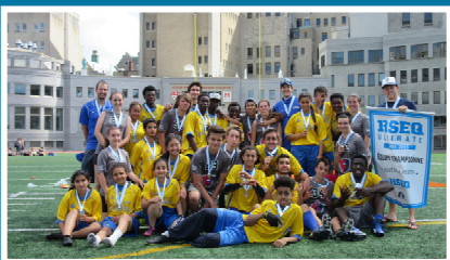
Finales d'ultimate Or : Cité-des-Jeunes | Argent : Saint-Laurent 1 | Bronze : Saint-Laurent A