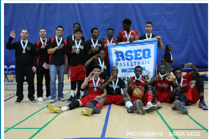
École secondaire Dorval-Jean-XXIII Champions provinciaux RSEQ - Cadet masculin Division 2