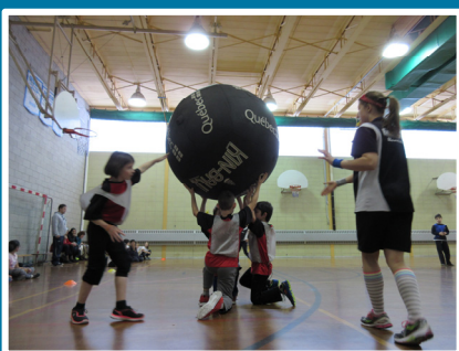
Festival de kinball Organisé à l'école secondaire Saint-Georges