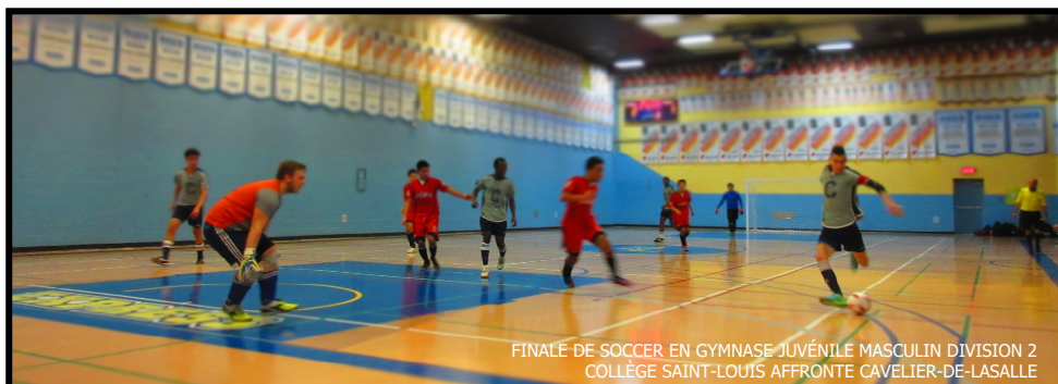
FINALE DE SOCCER EN GYMNASSE JUVÉNILE MASCULIN DIVISION 2 COLLÈGE SAINT-LOUIS AFFRONTÉ CAVELIER-DE-LASALLE

Directrice générale du RSEQ Lac-Saint-Louis