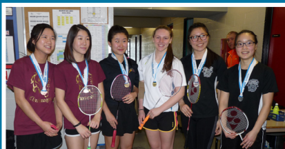
FINALES RÉGIONALES DE BADMINTON DIVISION 2 PODIUM – DOUBLE JUVÉNILE FÉMININ