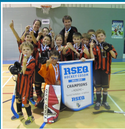
ÉCOLE PRIMAIRE GENTILLY CHAMPIONS – MINIME HOCKEY COSOM