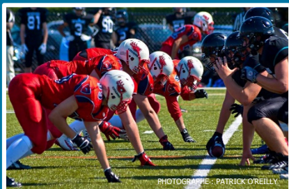
Football juvénile division 2 – bloc 6 Cité-des-Jeunes affronte Chêne-Bleu