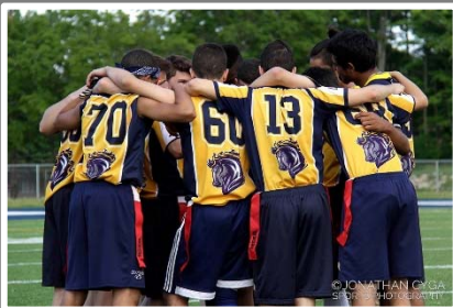
Collège Beaubois – Flag-football