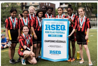
École primaire Gentilly – Mini flag-football