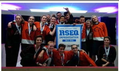
Cité-des Jeunes &amp; Dorval-Jean-XXIII – Improvisation