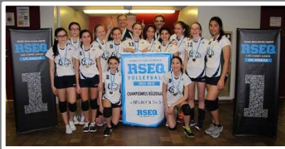
Collège Sainte-Marcelline - Volleyball