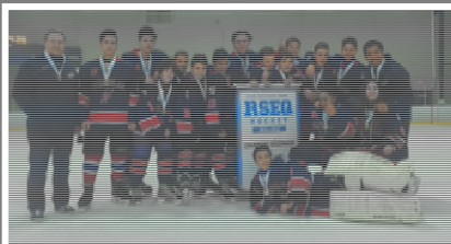
Collège Stanislas - Hockey